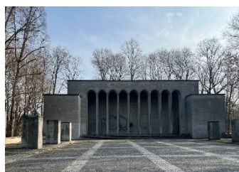
ヒトラーが演説をした広場

ナチス党大会跡地は一つの巨大な公園のようなエリア、でツェッペリン広場、ライトポルトハイン、コンGRESS・ホール、グローセ・シュトラッセ大通りなどの施設が点在しています。そこからさらに南にニュルンベルクメッセがあります。