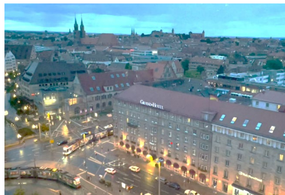
ニュルンベルクの旧市街地を望む

私自身、今回ニュルンベルクを訪れる機会に、ナチス時代の歴史に関わる場所をいくつか歩いてみました。きっかけは、機内で映画「ニュルンベルク裁判(Nuremberg)」を観たことでした。ニュルンベルク裁判をテーマにした作品で、この街の名前が持つ歴史的な意味を改めて考える機会になりました。