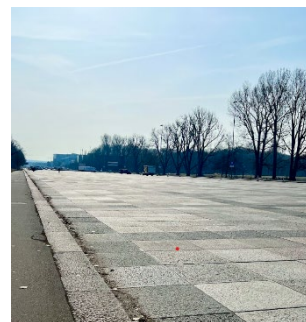
ナチス党大会の軍事パレードを行うためのメインストリートとして建設された巨大な舗装道路

され、その広大さに圧倒されます。巨大な建築と演出によって、ナチス国家の力を誇示する舞台が作られました。