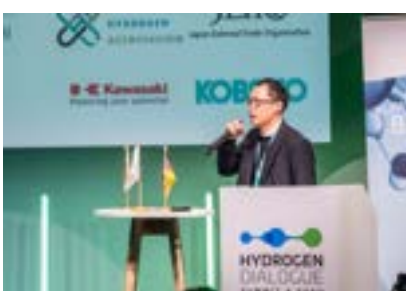
日本代表団のピッチ

HYDROGEN DIALOGUE には日本代表団 10 名を含む 17 の国際代表団(デリゲーション)が参加しましたが、初日の夜にはうち 10 か国の代表団が 1 分ピッチ(プレゼンテーション)を行い、水素経済の拡大における自分たちの立場、追求している目標、克服すべき課題などについて説明しました。プレゼンテーションの後、各国の国旗が掲げられたネットワーキングテーブルで、参加者が小グループに分かれ交流、意見を交換し、国際協力の基盤を築きました。