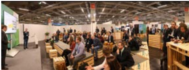
スタートアップ企業のピッチの様子