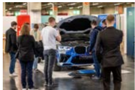
BMW の燃料電池水素自動車