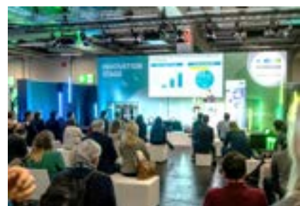
代表団ピッチの様子