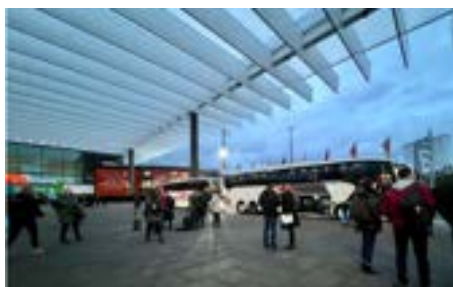
バスツアーに出掛ける国際訪問団