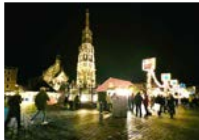
ニュルンベルク城近くの市内クリスマスマーケット

HYDROGEN DIALOGUE は水素経済の市場拡大を成功させるため、あらゆる分野や国境を越えて意思決定者と専門家を対話に招き交流を促進して参ります。今回のイベントに参加、ご協力を頂きました皆様に心より感謝申し上げます。